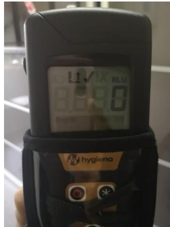
Lectura UFC Recepción