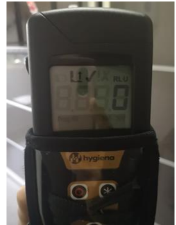
Lectura Recibo de Muestra

Fecha de emisión: 30 de septiembre de 2020