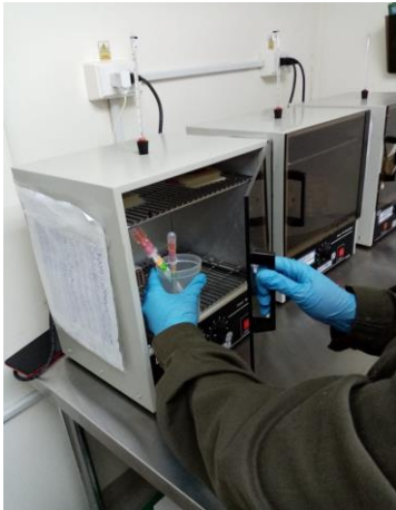
Incubación 6 horas Conteo UFC